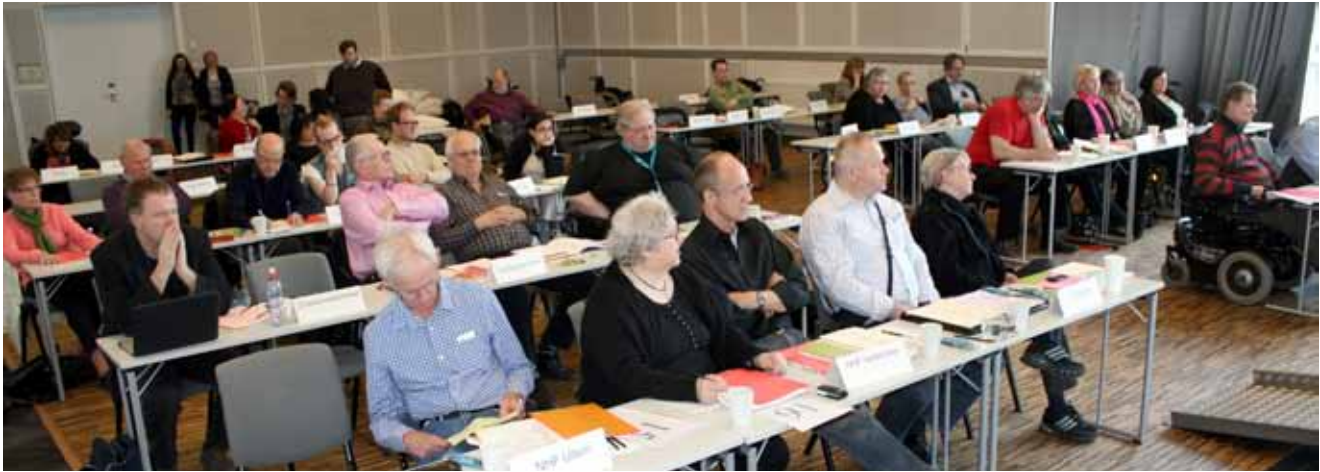
NHF Oslos årsmøte april 2013.

arbeidet. Laget står ikke minst for nytenkning når det gjelder kontakt med eget bydelsråd og å knytte det politiske arbeidet i bydelen inn mot eget lokallag.