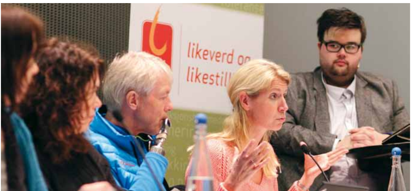
Fra Osloforum om 26-årsregelen.

Kampen for aktivitets- og fritidshjelpemidler (26-årsregelen) har vært en egen viktig sak og satsingsområde i 2013. Kampen har dreid seg om å fjerne den øvre aldersgrensen for slike hjelpemidler. Saken er av nasjonal karakter og NHF sentralt har